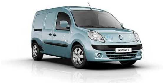
Die Elektro-Transporter Renault Kangoo Z.E.