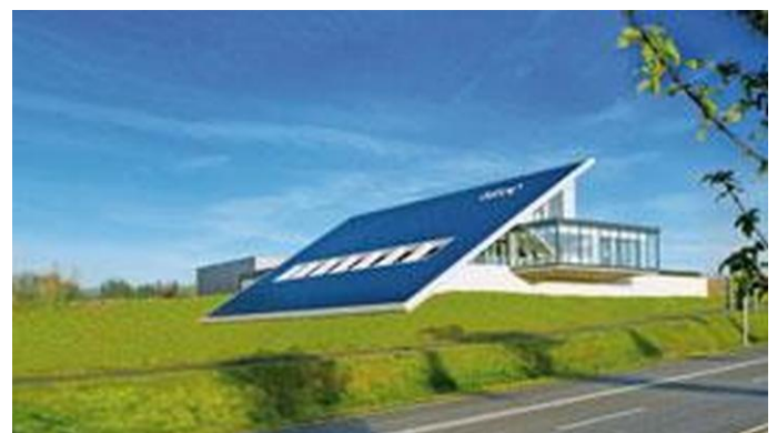
Die firmeneigenen Photovoltaikanlage bei Leitec

Gemessen am gesamten deutschen Stromverbrauch, der für das Jahr 2020 erwartet wird (573 Milliarden kWh), wäre der Anteil der Elektromobilität immer noch so gering (0,6 Prozent), dass er problemlos aus erneuerbaren Energien gedeckt werden könnte. Eine nachhaltige und klimafreundliche Elektromobilität wäre somit auch langfristig gesichert.