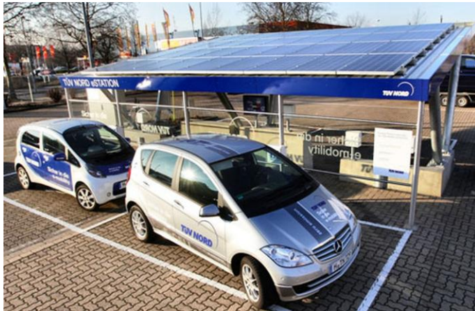
(Noch) kein typischer Fuhrpark. Der Photovoltaik-Carport des TÜV Hannover

Dominiert wird der Markt bislang klar von Herstellern und Modellen aus den USA sowie Japan, wie aus der Analyse hervorgeht. In diesen beiden Ländern sind zugleich die - rein zahlenmäßig - meisten Elektrofahrzeuge und Neuzulassungen zu verzeichnen, während Norwegen und die Niederlande bei den prozentualen Anteilen Spitzenwerte erreichen.