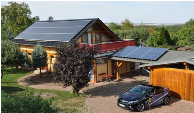
Immer mehr Hausbesitzer installieren Ladestationen für Elektrofahrzeuge in Garagen oder Solar-Carports. Hier ein Ausführungsbeispiel des Thüringer Unternehmens maxx solar GmbH (Waltershausen) mit dem Opel APMERA.