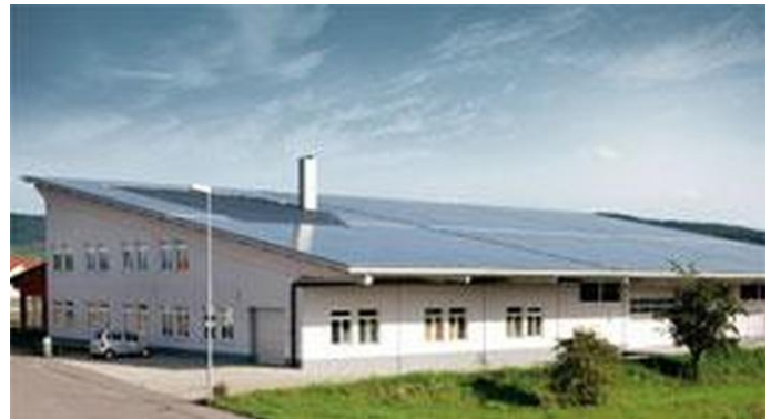
Durch vermiedene Stromkosten lohnt sich die Investition in gewerbliche Photovoltaik-Anlagen schon jetzt.

bedingungen stimmen. Das ist beispielsweise der Fall bei Fahrzeugen, die überwiegend kurze Strecken zurücklegen, wie die Flotten von Handwerkern, Autos von Pendlern oder Zweitwagen. Und das sind in Deutschland weit mehr als 10 Millionen PKW und Kleintransporter.