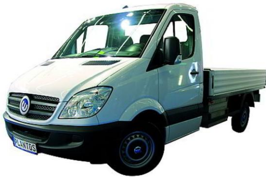
und Plantos (German E-Cars) sind bereits auf dem Markt

Mit dem neuen BMW i3 steigt nun auch ein deutscher Automobilhersteller in die nachhaltige, emissionsfreie Mobilität ein. Seine Reichweite liegt bei 130 bis 160 Kilometern, was für die überwiegende Mehrheit der Fahrer völlig ausreichend ist, denn die tägliche Fahrstrecke beträgt im weltweiten Durchschnitt lediglich 64 km. Und Branchen-Primus Tesla bietet mit der Limousine „Model S“ ein Serienfahrzeug an, das rein elektrisch fast 500 Kilometer schafft. Elektrische Serienfahrzeuge gibt es unter anderem von Mitsubishi, Renault und Nissan. Kleintransporter bieten unter anderem Renault und Peugeot an.