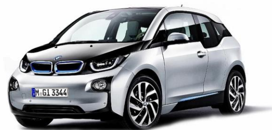
Der neue BMW i3 wird ab November 2013 in Deutschland und einer Reihe weiterer europäischer Märkte verkauft