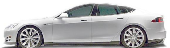
Teslas Limousine „Model S“ schafft rein elektrisch um die 500 Kilometer