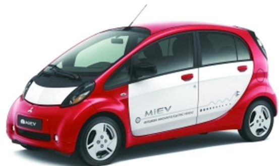
Der Kompaktwagen iMiEV von Mitsubishi ist bereits seit 2010 erhältlich

Viele Unternehmen aus Mittelstand, Handwerk und Industrie haben mittlerweile erkannt, dass das viel diskutierte Problem der Reichweite im Alltag meist keine entscheidende Rolle spielt, da bereits die heutigen Batterien Reichweiten von 100 - 200 Kilometern ermöglichen. Problematisch sind derzeit noch eher die mangelnde Verfügbarkeit geeigneter Elektro-PKW oder elektrisch betriebener Nutzfahrzeuge und noch die immer hohen Anschaffungskosten.