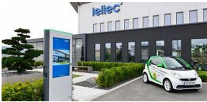
Am 16. September 2013 schaltete Thüringens Ministerpräsidentin Christine Lieberknecht die erste „Elektromobilitätsschnelladesäule mit Infotainment“ bei leitec frei. Damit gibt das Unternehmen den Startschuss für ein Mobilitätskonzept, das bidirektionales Laden von Elektrofahrzeugen durch die firmeneigenen Photovoltaikanlage ermöglicht.