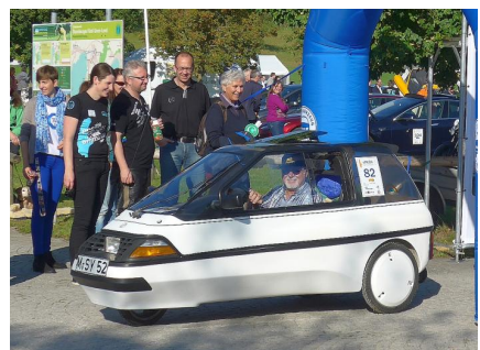
Das älteste Fahrzeug auf der eRuda, ab Seite 92