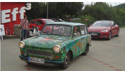
Fahren mit Sonne, Erlangen, ab Seite 60