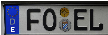
Europäische Kennzeichnung, Seite 26